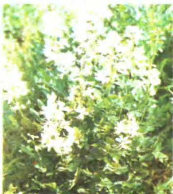
404. Ясенець білий.